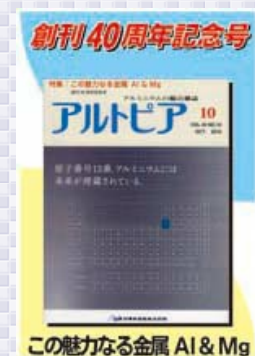
この魅力なる金属 Al & Mg